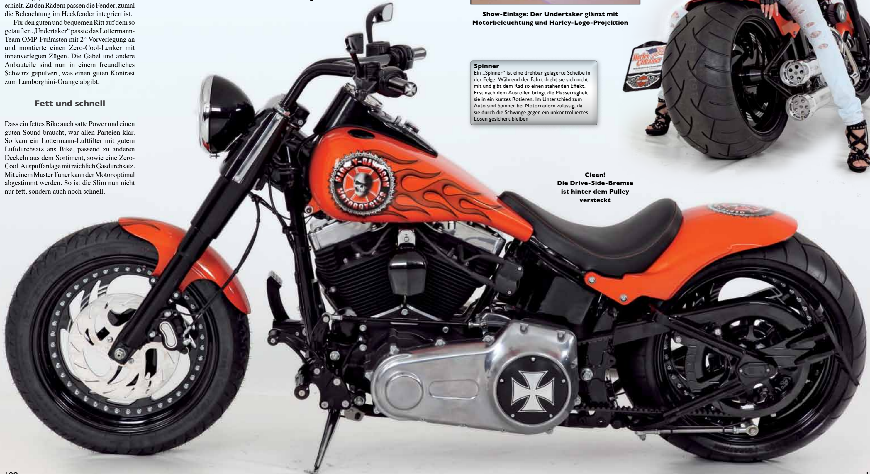
Clean! Die Drive-Side-Bremse ist hinter dem Pulley versteckt

Ein „Spinner“ ist eine drehbar gelagerte Scheibe in der Felge. Während der Fahrt dreht sie sich nicht mit und gibt dem Rad so einen stehenden Effekt. Erst nach dem Ausrollen bringt die Masse die Felge in ein kurzes Rotieren. Im Unterschied zum Auto sind Spinner bei Motorrädern zulässig, da sie durch die Schwinge gegen ein unkontrolliertes Lösen gesichert bleiben