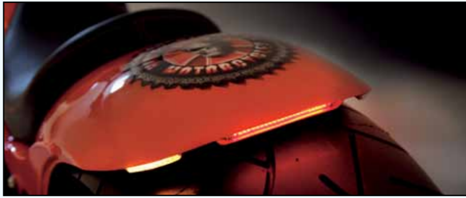
LEDs machen's möglich: Rücklicht und Blinker sind im breiten Fender integriert

Dass ein fettes Bike auch satte Power und einen guten Sound braucht, war allen Parteien klar. So kam ein Lottermann-Luftfilter mit gutem Luftdurchsatz ans Bike, passend zu anderen Deckeln aus dem Sortiment, sowie eine Zero-Cool-Auspuffanlage mit reichlich Gasdurchsatz. Mit einem Master Tuner kann der Motor optimal abgestimmt werden. So ist die Slim nun nicht nur fett, sondern auch noch schnell.